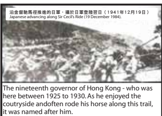
Mount Butler and Sir Cecil's Ride History 畢拿山 - 金督馳馬徑歷史