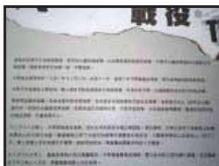
Mount Butler (Heritage) Race - The Greatest Race of All